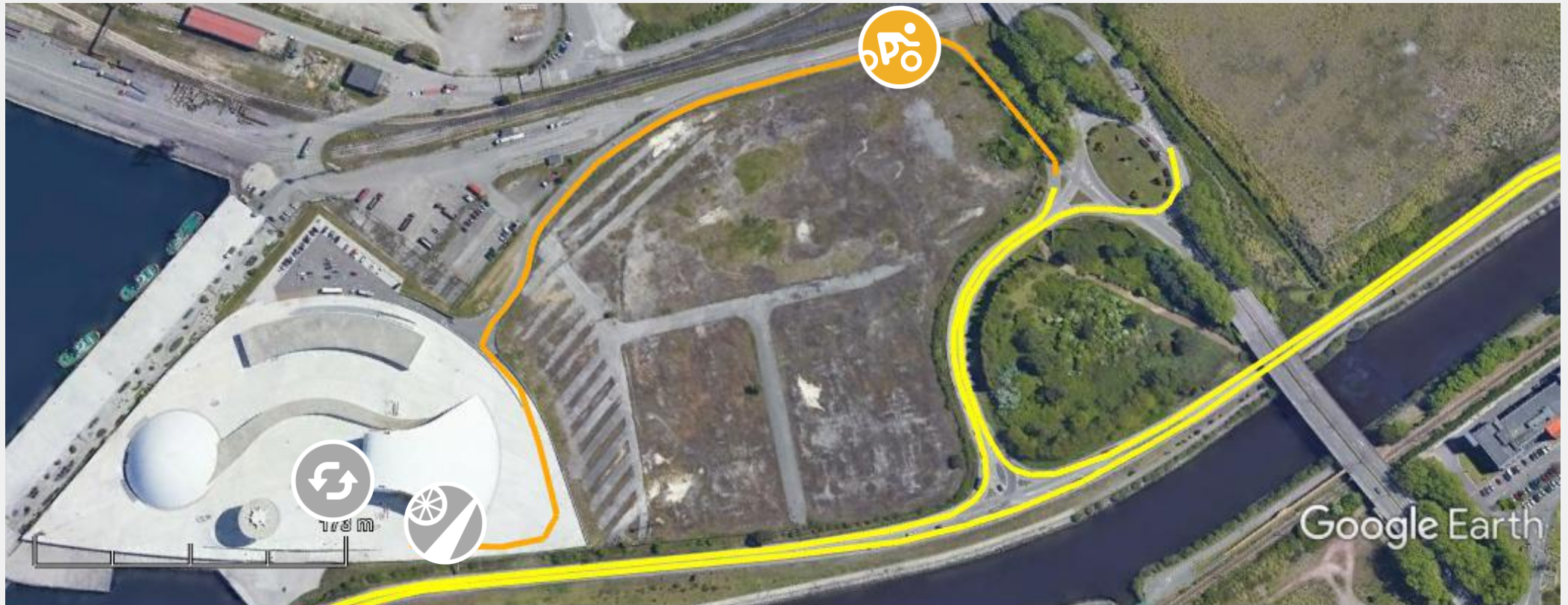
Gráfico: min.. media, máx. Elevación: 2, 4, 5 m Total de intervalo: Distancia: 651 m Incremento/pérdida de elevación: 4.22 m, -3.92 m Pendiente máxima: 5.6%, -18.5% Pendiente media: 0.7%, -3.9%