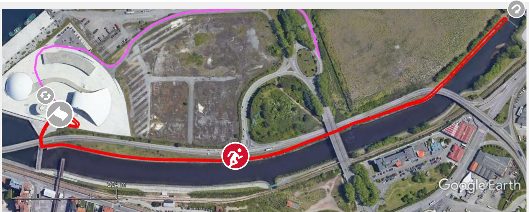
Gráfico: min., media, máx. Elevación: 0, 4, 6 m Total de intervalo: Distancia: 2.39 km Incremento/pérdida de elevación: 41.4 m, -41.5 m Pendiente máxima: 19.6%, -15.8% Pendiente media: 2.2%, -2.3%