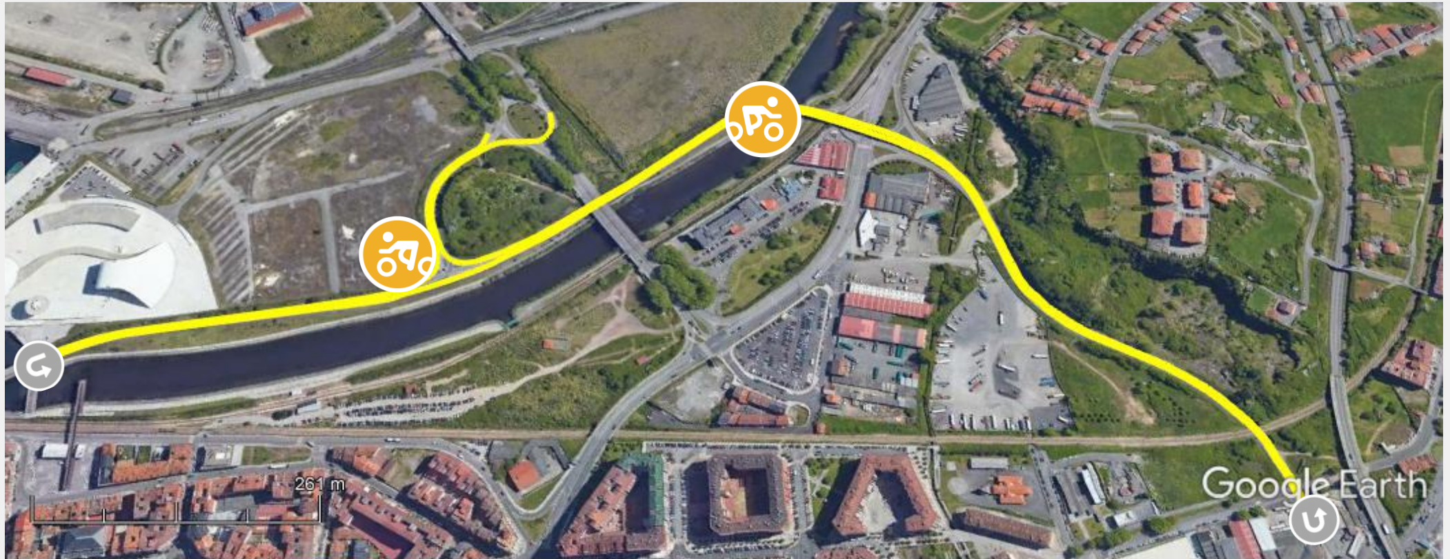
Gráfico: min., media, máx. Elevación: 1, 6, 14 m Total de intervalo: Distancia: 3.50 km Incremento/pérdida de elevación: 73.5 m, -73.3 m Pendiente máxima: 35.8%, -52.8% Pendiente media: 3.6%, -3.7%